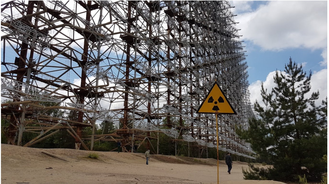
Afbeelding 9. De Doega-1 radar. Een van de drie over-the-horizon radars van de Sovjet-Unie, binnen vervreemdingszone rondom de kerncentrale van Tsjernobyl.

Aan het einde van mijn tour kreeg ik een certificaat waar een kaart van het gebied opstaat, en hoeveel straling ik in de volle dag heb ontvangen. Ik wilde achteraf natuurlijk de hoogst mogelijke waarde op het certificaat, dus ik heb de geigertellermeting van een van de gidsen gebruikt: 0,006 mSv. Daar zat een beetje valsspelen bij, want de gids heeft zijn meter naast een heel grote hotspot gehouden waar hij wel >400 mSv mat; de gemiddelde gemeten stralingsdosis van mijn tourgroep was ongeveer de helft van bovenstaande waarde. Een dagje Tsjernobyl levert dus vandaag de dag evenveel straling op als één of twee uur vliegen - dat valt nog best mee!