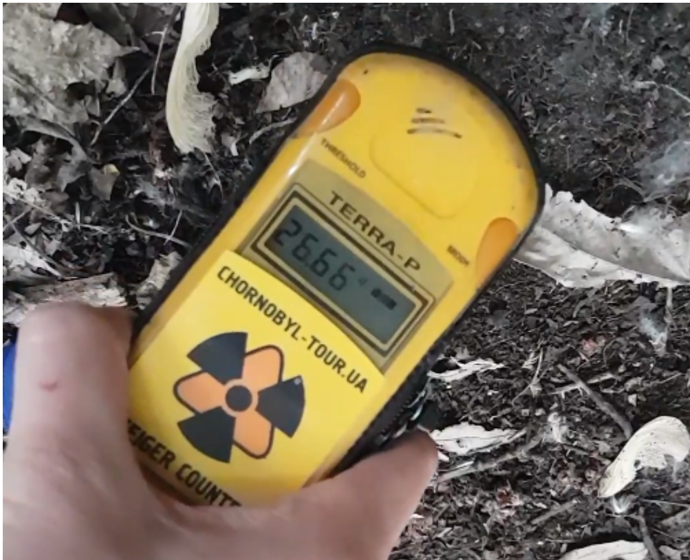
Afbeelding 6. De gemeten straling dicht bij een radioactieve hotspot in de grond. De geigerteller geeft 26,66 mSv aan.

Sommige gebieden zijn zo erg besmet dat je ze niet mag betreden. Een zo'n gebied is het Rode Bos, een bos enkele kilometers ten westen van de kerncentrale dat zoveel radioactieve neerslag over zich heen kreeg dat de bomen al hun blaadjes verloren en hun basten een rode tint kregen. Toen onze bus langs dit bos reed begonnen alle geigertellers te piepen door het hoge stralingsniveau.