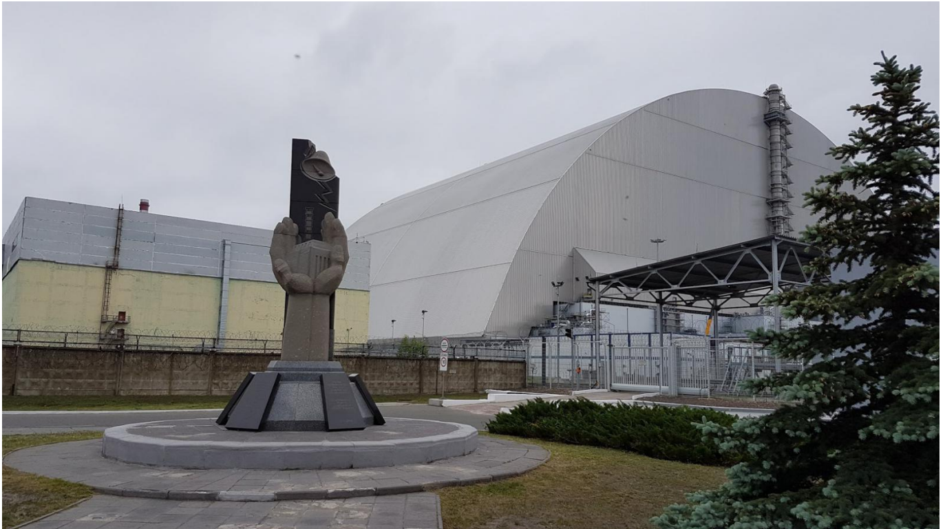
Afbeelding 7. Kernreactor nummer 4, omhuld in een nieuwe sarcofaag.