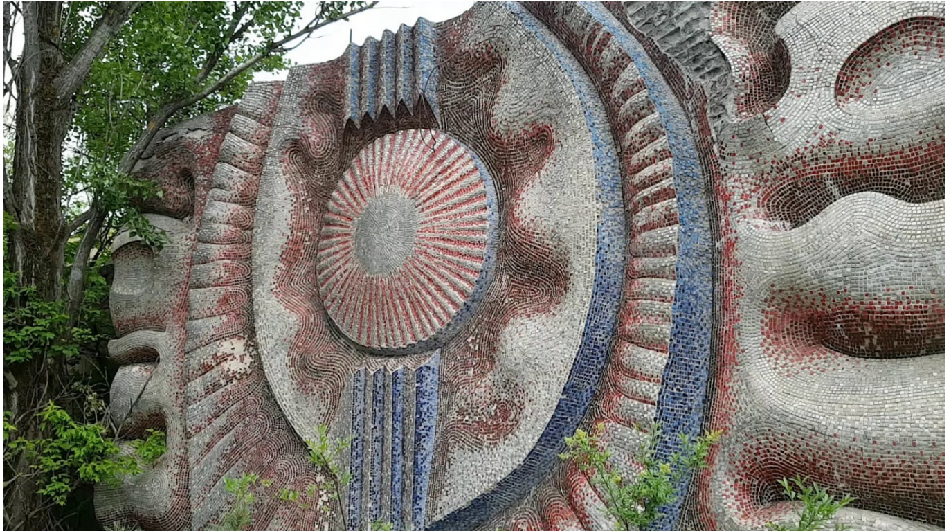
Afbeelding 8. Beelden van Pripjat. Van boven naar onder: botsauto's in het pretpark, het overgroeide stadion en mooi mozaiekwerk.

Hoewel niet verwant aan de kernramp, bevat de vervreemdingszone ook een (nu-niet-meer-)geheim radarstation van de Sovjet-Unie. De radar die hier staat is een zogeheten over-the-horizon radar: een gigantische metalen constructie van 135 meter hoog en 300 meter breed die radiogolven van de juiste frequentie uitzendt die gereflecteerd worden van de ionosfeer (een laag in de atmosfeer) en zo voorbij de horizon kunnen kijken. Deze radar was bedoeld als vroegtijdige waarschuwingsmethode voor raketlanceringen uit de Verenigde Staten. De frequentie die dergelijke radars uitzonden veroorzaakte wereldwijd een tikkende ruis in radiozendingen, waardoor ze de bijnaam "Russian Woodpecker" (Russische specht) kregen, en ze lang niet zo geheim waren als de Sovjet-Unie had gehoopt.