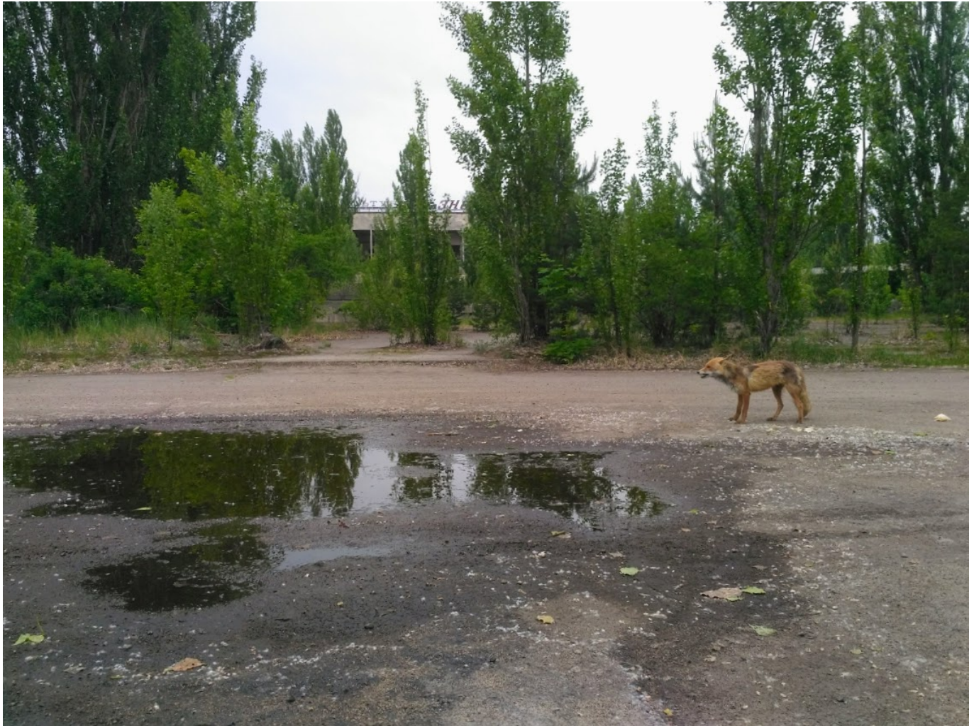
Afbeelding 5. Een centraal plein in Pripjat. Hier moeilijk te zien, maar deze foto is gemaakt midden in de stad Pripjat. In de achtergrond is nog een deel van een gebouw te zien.

Ondanks de grote hoeveelheid radioactieve stoffen die de lucht in stegen, werd er in de eerste instantie over het ongeluk gezwegen door de Sovjetautoriteiten. Er stond op de dag van het ongeluk een wind in westelijke richting, waardoor de radioactieve wolk zich richting West-Europa verspreidde. Op 28 april werden in Zweden verhoogde niveaus van radioactiviteit gemeten, en werd er alarm geslagen. Laat in de avond van de 28 e kwam pas de eerste, nogal korte officiële publieke erkenning van de Sovjetautoriteiten dat het ongeluk was gebeurd: