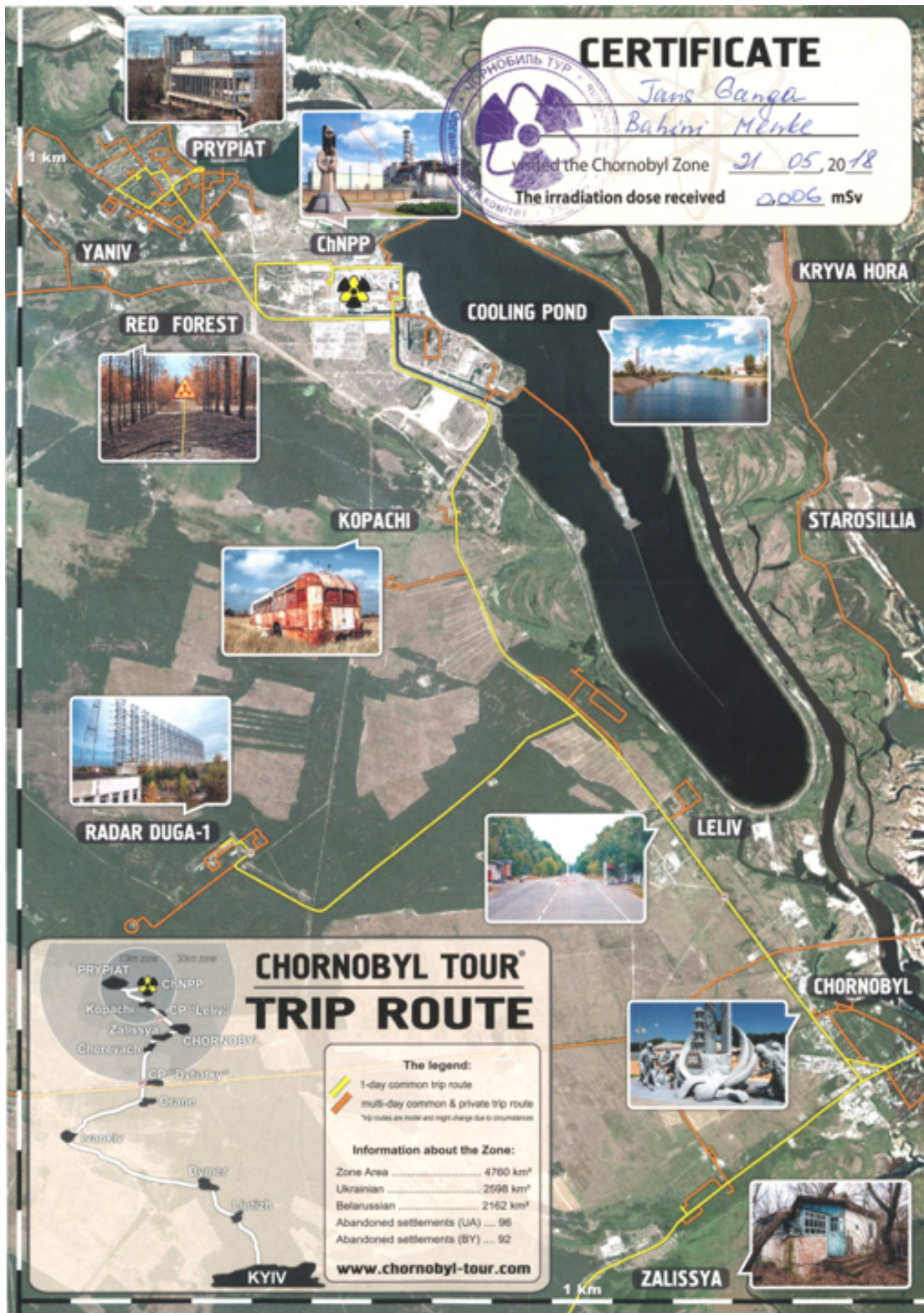
Afbeelding 10. Certificaat van mijn bezoek aan Tsjernobyl.