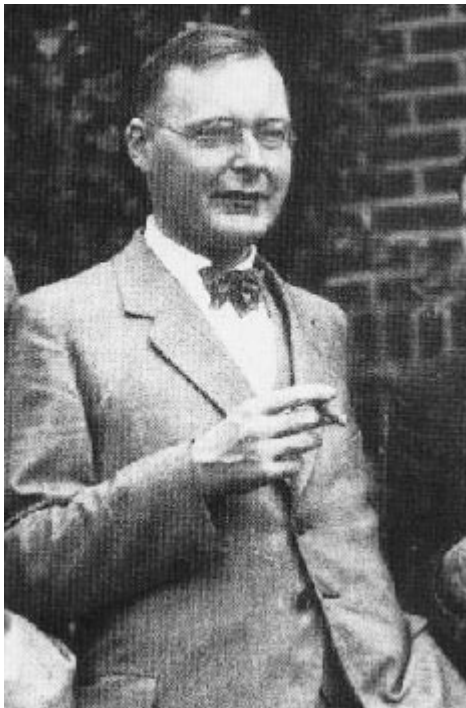
Afbeelding 3. Hendrik Anthony Kramers. Kramers was een van die grondleggers van de WKB- (of KWB?)-benadering.

voortaan spreken van de KWB-benadering, ter ere van de Nederlandse natuurkundige Hendrik Anthony Kramers!