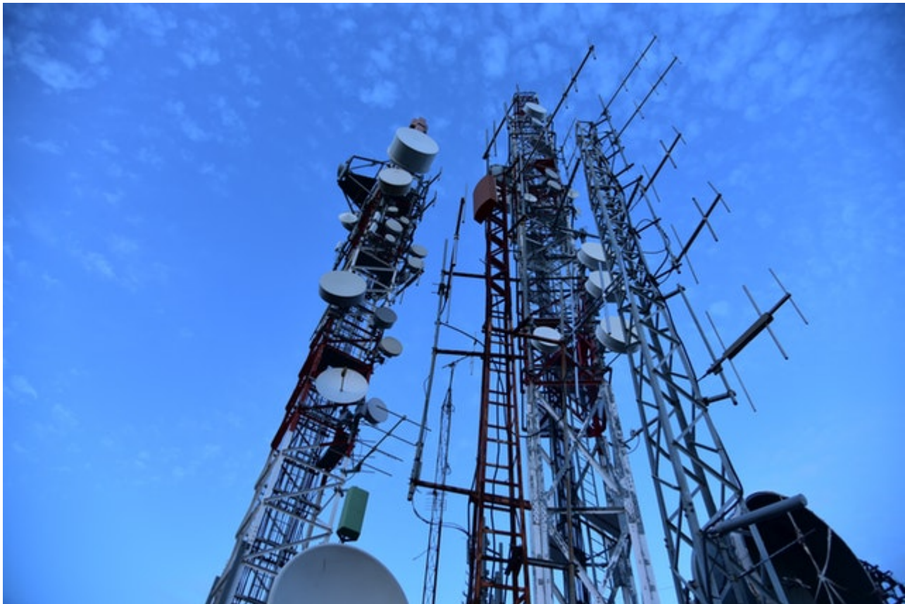
Afbeelding 1. Antennes. Antennes vormen waarschijnlijk de bekendste en meest gebruikte toepassing van versnellende ladingen.

Sinds het eind van de 19de eeuw weten we dat licht bestaat uit elektrische en magnetische velden die trillen in het vacuüm. Door middel van de Maxwellvergelijkingen kunnen we die trillingen goed begrijpen en een voorspelling doen over hun voortplantingssnelheid, de lichtsnelheid. Een missend onderdeel in dit begrip is echter het ontstaan van licht, of algemener: het ontstaan van straling. Hoe maak je trillende elektrische en magnetische velden? In dit artikel zullen we deze vraag beantwoorden door naar een heel eenvoudig voorbeeld te kijken: een versneld elektron.