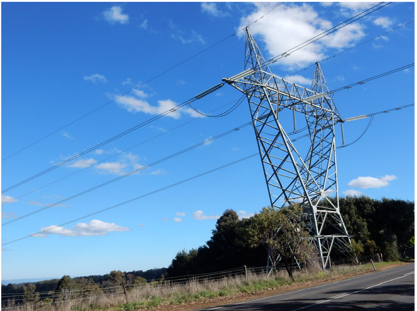
Afbeelding 1. Een hoogspanningsmast. Verrassend maar waar: de energie stroomt niet

Hoe komt de energie die elektriciteitscentrales opwekken uiteindelijk terecht in ons huis? Het beeld dat de meeste mensen hebben is dat van elektronen die in de centrale ieder een beetje energie krijgen en dan een lange reis door het stroomnet maken, om uiteindelijk deze energie af te geven in je lamp, TV of waterkoker. Als de energie eenmaal is afgestaan, vervolgen de elektronen hun reis door de kabel terug het stroomnet in. Dit beeld is echter om meerdere redenen incorrect.