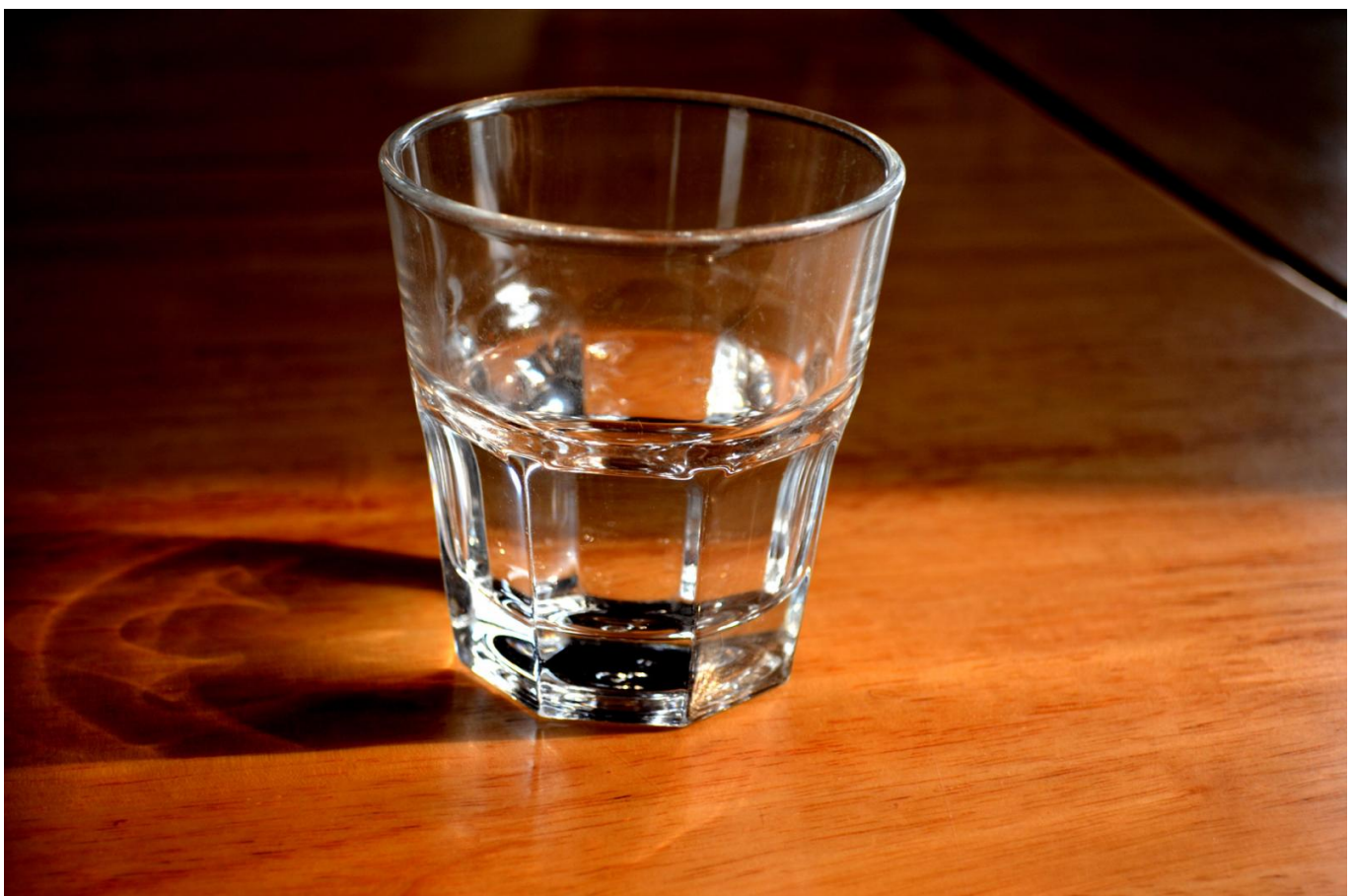
Afbeelding 1. Een glas water. Water is doorzichtig - maar waarom eigenlijk?

Sommige materialen zoals water laten licht heel gemakkelijk door, terwijl voor andere materialen zoals witte verf dat niet zo eenvoudig gaat. In dit artikel zien we waarom dit het geval is en wat dit te maken heeft met de Nobelprijzen van 1977 en 2014.