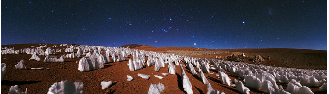
Afbeelding 2. Nieves penitentes.

dat proces wel degelijk belangrijke gevolgen. Het beïnvloedt bijvoorbeeld het klimaat (aangezien ijs zonlicht reflecteert) en heeft gevolgen voor de grootte en vorm van ijsdeeltjes in wolken (waaruit sneeuwvlokken, hagelstenen en ijsregen ontstaan) en is van doorslaggevend belang voor de vorming van complexe erosiepatronen zoals de 'nieves penitentes' die op grote hoogten in sneeuwvlaktes kunnen ontstaan.