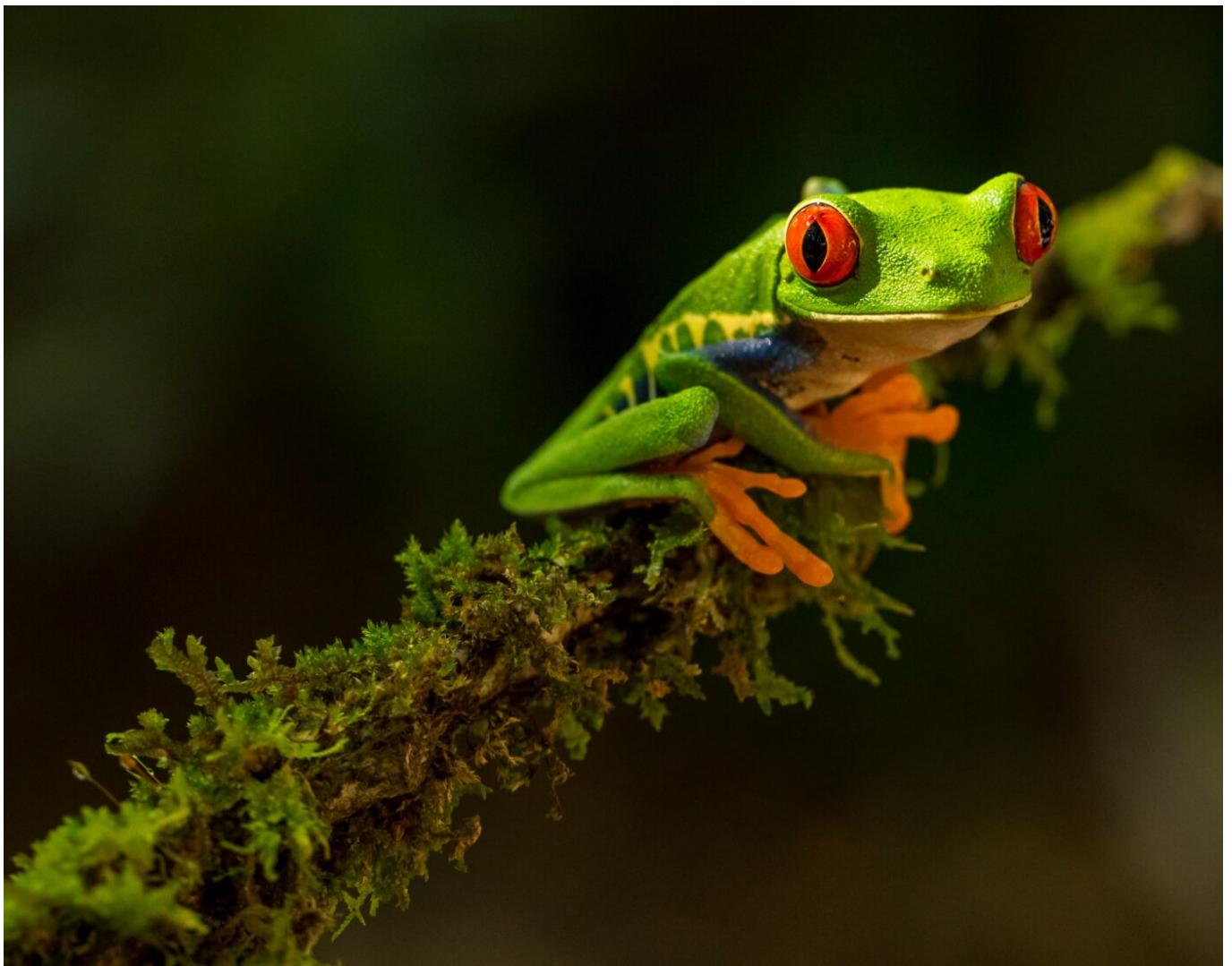
Afbeelding 1. Een roodoogmakikker in Costa Rica.

De Ig Nobelprijs is een jaarlijkse prijs voor onderzoek dat mensen laat lachen, maar dat stiekem ook interessante consequenties kan hebben. In 2000 werd de prestigieuze prijs uitgereikt aan onderzoekers die bewezen dat je met magneten kikkers kunt laten zweven.