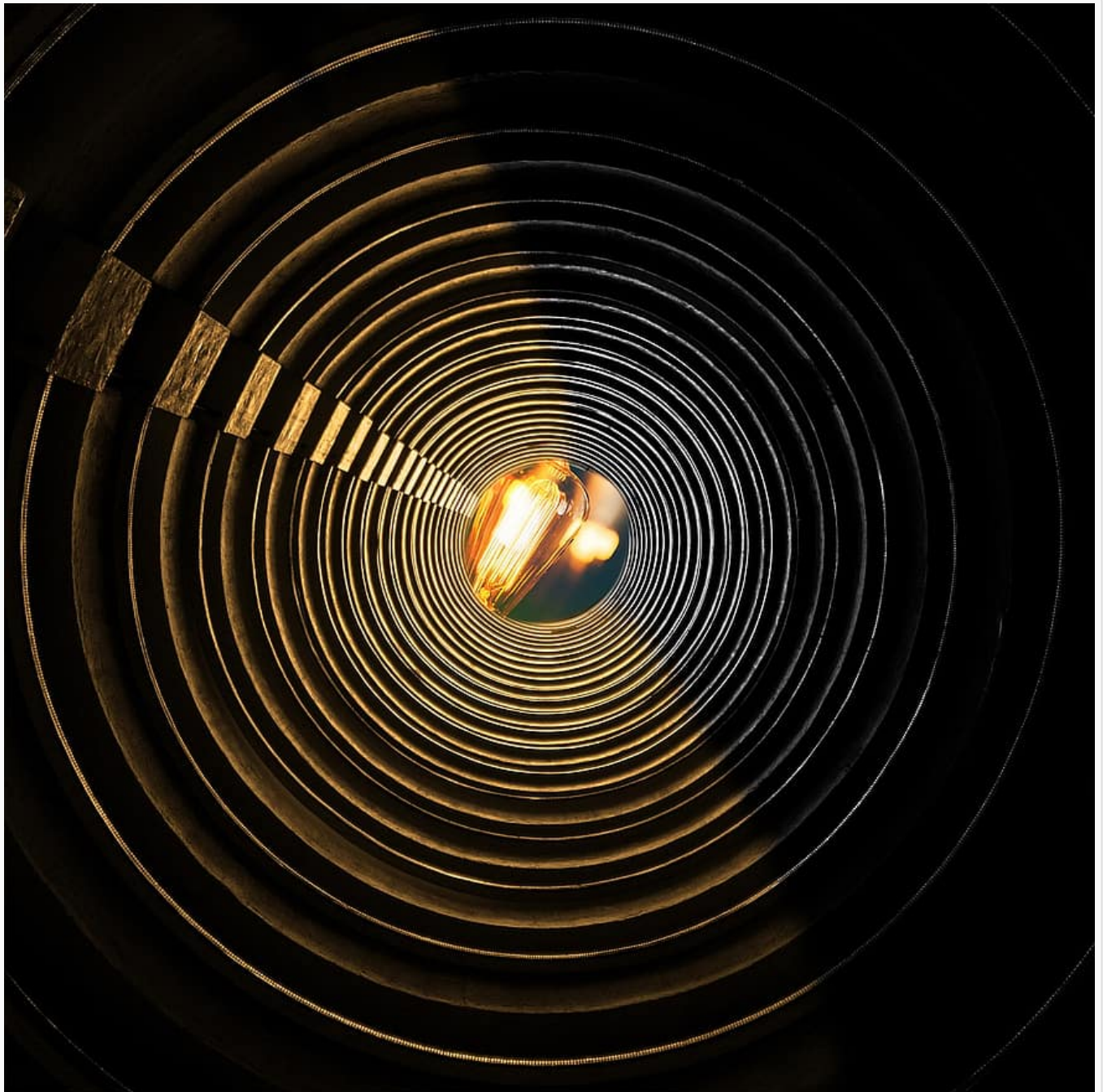
Afbeelding 1. Ligt er goud achter de horizon van een zwart gat?

Sinds de jaren 70 weten we dankzij het werk van Jakob Bekenstein en Stephen Hawking dat zwarte gaten een entropie hebben, een eigenschap die iets zegt over de hoeveelheid informatie die het zwarte gat bevat, en dat die entropie evenredig is met hun oppervlakte.