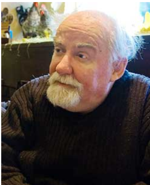
Afbeelding 2. John McKay. De ontdekker van de monstrous moonshine.

Het moge duidelijk zijn dat het beschrijven van zo’n gigantische structuur niet eenvoudig is. Gelukkig bestaat er voor die beschrijving een hulpmiddel: de elementen die de monstergroep vormen kunnen gezien worden als symmetrie-operaties in bepaalde hogerdimensionale ruimtes. Er zijn zelfs oneindig veel manieren om dit te doen. In het eenvoudigste geval is de ruimte waarvan de monstergroep symmetrieën beschrijft ééndimensionaal – een lijn, dus. In het op één na eenvoudigste geval heeft deze ruimte maar liefst 196.883 dimensies!