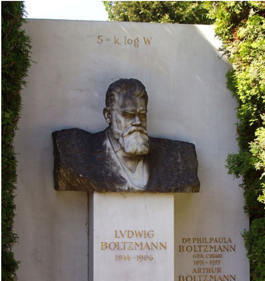
Afbeelding 2. Ludwig Boltzmann (1844-1906). Het graf van Boltzmann – de ‘vader van de entropie’ – in Wenen. Boven de buste staat de formule geschreven waarin Boltzmann weergaf dat de twee verschillende definities van entropie tot dezelfde uitkomst leiden.

De entropie van een thermodynamisch systeem kan op twee op het oog heel verschillende manieren beschreven worden.