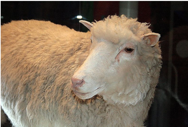
Afbeelding 3. Dolly. Dolly, het beroemde geklonde schaap . Hoewel het klonen van een schaap mogelijk is, blijkt het klonen van een quantumtoestand dat niet te zijn.

Zou het kunnen dat de informatie zowel in het zwarte gat verdwijnt als weer naar buiten komt? Ook deze gedachtesprong lijkt in eerste instantie veelbelovend. We kennen in het dagelijks leven genoeg situaties waarin informatie op verschillende plaatsen tegelijk belandt. Als ik een e-mail naar persoon A stuur met een cc naar persoon B, arriveert de informatie die ik verstuurd heb uiteindelijk op twee verschillende plaatsen. Als ik een brief een aantal maal kopieer en vervolgens verstuur, verspreid ik ook dezelfde informatie over verschillende eindbestemmingen.