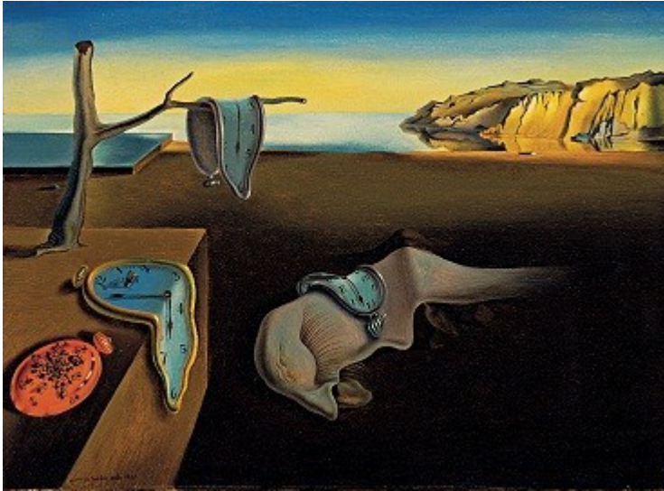
Afbeelding 2. The Persistence of Memory. In zijn beroemde schilderij 'The Persistence of Memory' wil Salvador Dalí de bijzondere manier weergeven waarop verschillende waarnemers volgens de relativiteitstheorie ruimte en tijd waarnemen. Het origineel van dit schilderij is te zien in het Museum of Modern Art in New York.

Dit 'vertragen' van de tijd op de rand van een zwart gat heeft een heel belangrijk gevolg. Wie van veraf kijkt naar een deeltje dat in een zwart gat valt, zal dat deeltje vreemd genoeg dus steeds langzamer naar het zwarte gat toe zien vallen naarmate het dichterbij het zwarte gat komt. Sterker nog: de waarnemer op grote afstand zal het deeltje nooit de horizon zien passeren! Het deeltje zal steeds dichterbij de horizon lijken te komen, maar doet dat steeds langzamer en langzamer, waardoor het het laatste kleine stukje nooit helemaal lijkt af te leggen. Van veraf gezien lijken we daardoor rondom een zwart gat een soort 'schil' net buiten de horizon te zien waarop alle invallende materie 'vastgeplakt' zit.