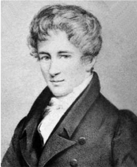
Afbeelding 3. Niels Henrik Abel(1802-1829).Abel voltooide in 1824 het bewijs van de stelling waaraan Paolo Ruffini in 1799 begonnen was. De stelling is daarom naar beide wiskundigen vernoemd.

Misschien lijkt het beschrijven van een zwart gat in vijf dimensies of meer je sowieso al niet erg nuttig – onze ruimte heeft immers maar drie dimensies! Toch zijn er allerlei natuurkundige modellen, zoals bijvoorbeeld de snaartheorie , waarin dit soort hogerdimensionale zwarte gaten een rol spelen.