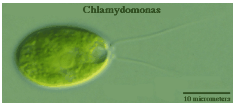
Afbeelding 1. Chalydomonas. De algensoort Chalydomonas reinhardtii kan zwemmen door een soort borstslag uit te voeren met twee lange dunne armen (flagella). Afbeelding: Rice University .

In het vorige artikel in deze serie hebben we hebben gezien dat in vloeistoffen op microschaal het effect van traagheid volledig gedomineerd wordt door het effect van wrijving. Het gevolg hiervan is dat kleine zwemmers zoals bacteriën of algen de vloeistof om zich heen als zeer stroperig ervaren, waardoor het moeilijk is om überhaupt vooruit te komen. In dit artikel kijken we in nog meer detail naar zwemmen op kleine schaal. Daarbij zullen we zien dat het ontbreken van traagheid bepaalde eisen oplegt aan de zwemslag die een zwemmer uitvoert.